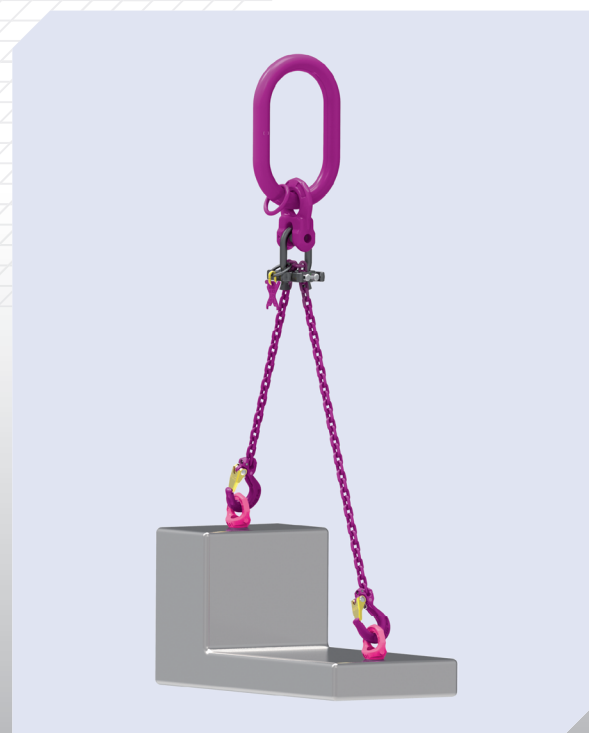
2-Strang mit Minilifter und IAK-RG 1-10 passend bis Kranhaken-Nr. 6 (DIN 15401).

In addition to the minilifter, just simply use the appropriate ICE master link IAK-RG-1