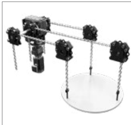
Dreifachstrang mit PI-GAMMA-Antrieb Auch in 5- und 6-fach-Anordnung mit Antrieben je nach Anwendung möglich. Gleichmäßiges Anheben möglich.