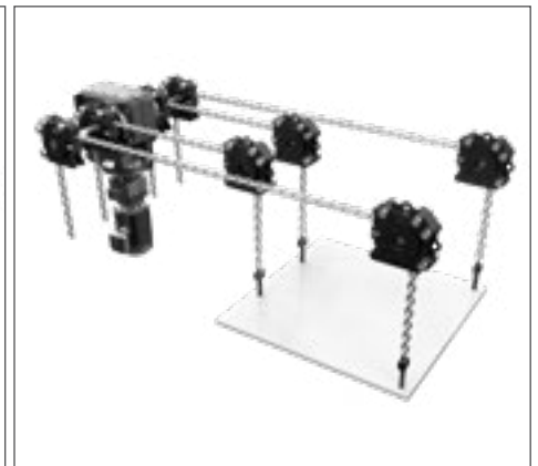
Vertikaler PI-GAMMA-Antrieb Auch in 5- und 6-fach-Anordnung mit Antrieben je nach Anwendung möglich. Gleichmäßiges Anheben möglich.