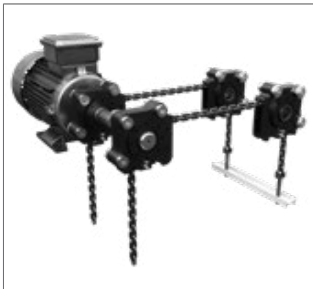
Doppelstrang mit PI-GAMMA-Antrieb Auch in 3- und 4-fach-Anordnung mit Antrieben je nach Anwendung möglich.