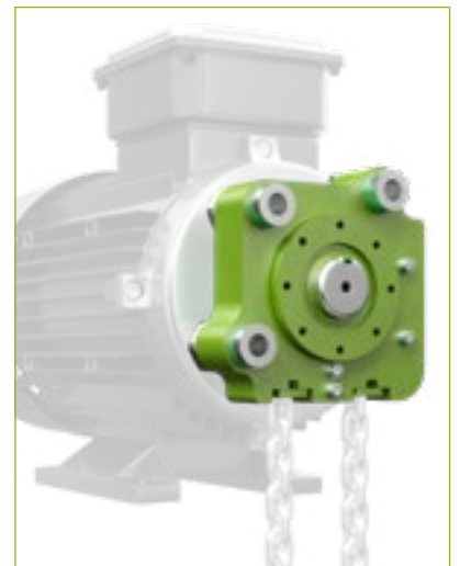
Vertikaler PI-GAMMA-Antrieb Auch in 3- und 4-fach-Anordnung mit Antrieben je nach Anwendung möglich.