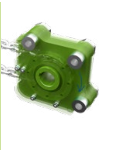
Horizontaler PI-GAMMA-Antrieb Auch in 2-, 3- und 4-fach-Anordnung mit Antrieben je nach Anwendung möglich.